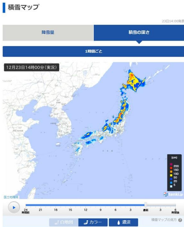
「積雪マップ」表示イメージの画像(全国)

今回新たに提供を開始する「積雪マップ」は、過去7日前から今後6時間後までの降雪量と、過去24時間前から、6時間後までの積雪の深さを、全国・地方ごとの地図上に色分けで表示する機能です。地図上のスライダーを操作することで、時系列での降雪・積雪状況の推移をご確認いただくことも可能です。